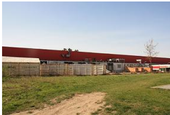
Abbildung 6: Blick auf das Einkaufszentrum aus Sicht der Siedlung

Das Gelände selber hatte vor Mitte der 70er Jahre im Vergleich zu der gegenwärtigen Fläche etwa die doppelte Größe. „1974 wurde etwa die Hälfte des Grundstücks verkauft und dort das Huma-Interspar Einkaufszentrum errichtet.“ (URL 4: CABULA6 Projekt Beschreibung : 6) Aus dem Wald- und Wiesengebiet wurde ein Einkaufstempel, der auch heute noch westlich der Siedlung steht.