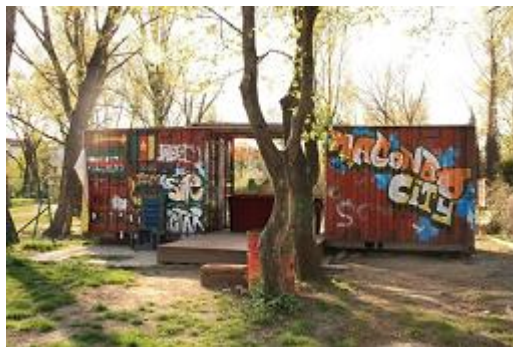
Abbildung 11: Der Container des Nachbarschaftsgarten

Ich setze mich etwas abseits des Spielfeldes auf eine Art Plattform. Diese Plattform führt durch einen Container hindurch und hinein in einen Garten. Von hier aus habe ich das Geschehen gut im Blick und kann mich wieder auf meine Beobachtungen konzentrieren.