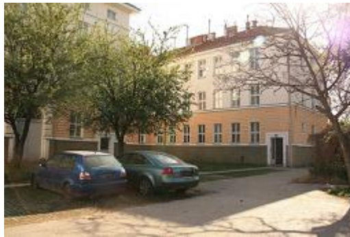
Abbildung 4: Wohnungen der ehemaligen Kasernengebäude

Mit der ersten Flüchtlingswelle aus Ungarn bekam das Gelände wieder einen neuen Nutzen. Die ehemaligen Kasernengebäude wurden nun zu Wohnungen umfunktioniert.