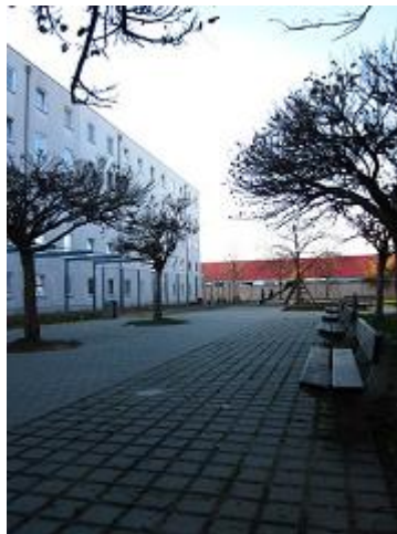
Abbildung 10: Hof zwischen den Häusern des Österreichischen Integrationsfonds

Das tue ich nun also. Das Wetter ist für Anfang November überraschend mild und die Sonne scheint. Viele Leute bewegen sich zwischen den Häusern. Um einen ersten Überblick zu gewinnen, setze ich mich auf eine Holzbank und beobachte von dort aus das Geschehen.