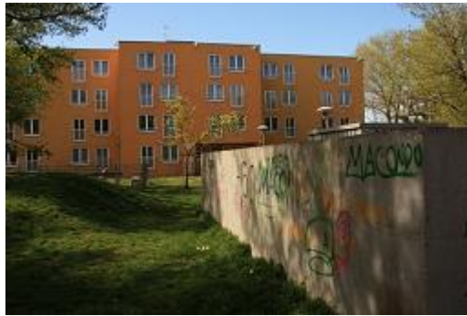
Abbildung 7: Blick auf das „Gelbe Haus“

Die weiteren drei Häuser des ÖIF dienen nach wie vor als Wohnhäuser. Sie unterscheiden sich jedoch in Architektur, Nutzung und sozialer Zusammensetzung von den Gebäuden der ehemaligen Kasernen und den Reihenhäusern. Dazu jedoch später mehr.