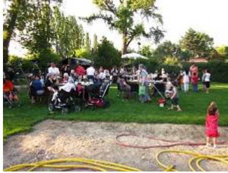
Abbildung 13: Gartenfest für BewohnerInnen und Beteiligte des Theaters

Gerade die Monate des Frühjahres waren, meiner Ansicht nach, von vielen Ereignissen und Aktivitäten in und um Macondo geprägt. Auch das öffentliche Interesse und somit das Informieren der WienerInnen über diesen besonderen Ort ging mit diesen Aktivitäten verstärkt einher. Auch ein Kamerateam von Okto-TV (vgl.: URL 14: Diskussionssendung auf Okto-TV ) war vor Ort, um etwas über Garten und Siedlung zu berichten.