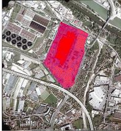
Abbildung 3: Satellitenaufnahme mit Sicht auf Macondo und das Huma Einkaufszentrum (hier dunkelrot)

Mit der ersten Flüchtlingswelle aus Ungarn bekam das Gelände wieder einen neuen Nutzen. Die ehemaligen Kasernengebäude wurden nun zu Wohnungen umfunktioniert.