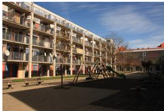
Abbildung 8: Wohnungen des Österreichischen Integrationsfonds

Die weiteren drei Häuser des ÖIF dienen nach wie vor als Wohnhäuser. Sie unterscheiden sich jedoch in Architektur, Nutzung und sozialer Zusammensetzung von den Gebäuden der ehemaligen Kasernen und den Reihenhäusern. Dazu jedoch später mehr.