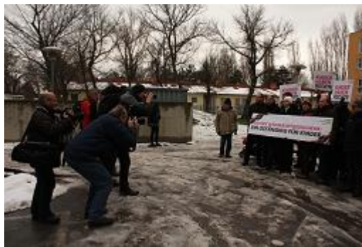
Abbildung 14: Protestaktion „Keine Schubhaft für Kinder“

Eine handvoll FotografInnen schießen Fotos und auch der ORF ist mit einer TV-Kamera vor Ort. Zwei SprecherInnen richten sich in ihren Ansprachen gegen den geplanten Bau eines Abschiebezentrums. Es macht den Anschein, als kämen sämtliche Beteiligte aus der Politik – jedenfalls anwesend sind: Senol Akkilic, Integrationssprecher der Grünen; Klaus Werner-Lobo, Menschenrechtssprecher der Grünen; Alev Korun, Integrations- und Menschenrechtssprecherin der Grünen im Parlament. Aktive Anteilnahme am Protest durch BewohnerInnen scheint nicht vorherrschend zu sein.“ Nur durch Zufall erfuhr ich von dieser Protestaktion, die BewohnerInnen selber blieben auch hier scheinbar uninformiert.