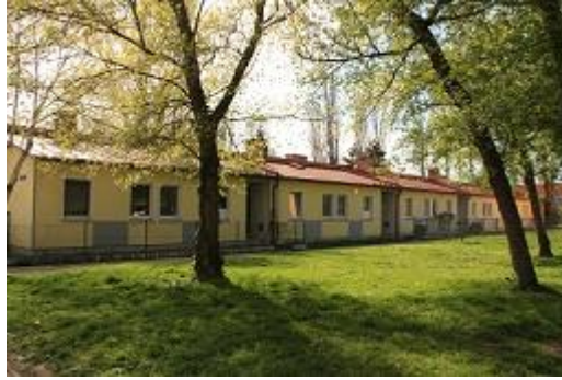
Abbildung 5: Reihenhäuser der Siedlung

Das Gelände selber hatte vor Mitte der 70er Jahre im Vergleich zu der gegenwärtigen Fläche etwa die doppelte Größe. „1974 wurde etwa die Hälfte des Grundstücks verkauft und dort das Huma-Interspar Einkaufszentrum errichtet.“ (URL 4: CABULA6 Projekt Beschreibung : 6) Aus dem Wald- und Wiesengebiet wurde ein Einkaufstempel, der auch heute noch westlich der Siedlung steht.