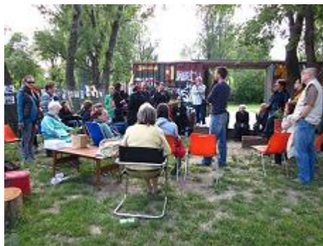
Abbildung 12: Exkursion Nachbarschaftsgarten „Macondo“

Im Zuge der Wiener Festwochen veranstaltete die Stadt Wien eine Exkursion (vgl.: URL 12: Exkursion „Nachbarschaftsgarten Macondo“ ) in diesen Garten. Über 30 Anmeldungen gingen ein und die Exkursion wurde ein voller Erfolg. Stadtforscher, Gärtner, Sozialarbeiter, Macondo-Interessierte; die TeilnehmerInnen bildeten einen bunten Mix. Auch das Stadtmagazin Dérive , ein Magazin für Stadtforschung, war dabei, um einen Beitrag (vgl.: URL 13: Radio für Stadtforschung/Macondo ) für deren Sendung auf Radio Orange aufzunehmen.