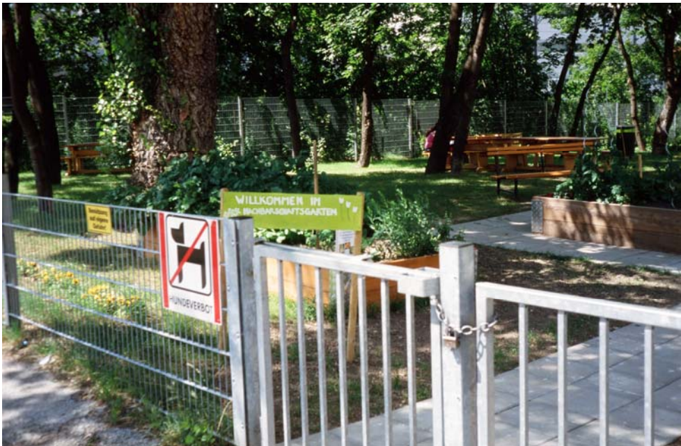
Abb. 3: „Nachbarschaftsgarten Heigerlein“