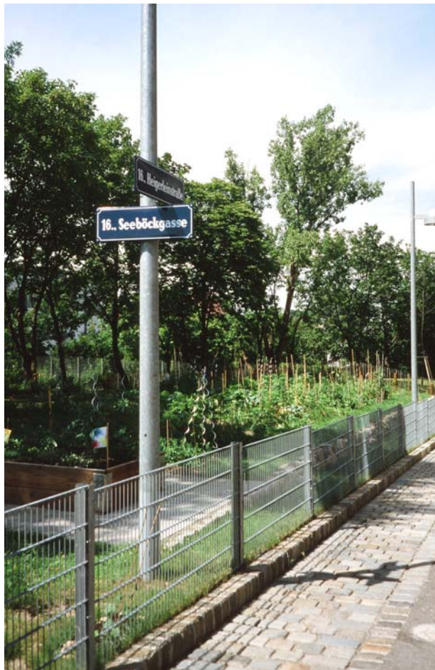
Abb. 1: „Nachbarschaftsgarten Heigerlein“